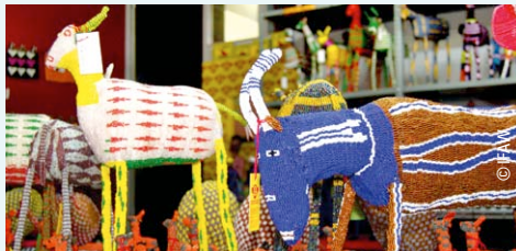
Farbenfrohe Tiere aus Perlen entstehen in Handarbeit im Projekt „Monkeybiz“.

Das landestypische Kunsthandwerk bietet sehr schöne und ausgefallene Perlenstickereien, Drahtflechtarbeiten und Steinfiguren. Mit dem Kauf dieser Produkte unterstützen Sie die lokale Wirtschaft. Im Township-Projekt „Monkeybiz“ beispielsweise stellen Frauen Perlenstickereien her. Ihre Erlöse fließen teilweise in soziale Einrichtungen. Mit solchen Souvenirs erhalten Sie die Tierwelt und bieten den Einheimischen ein Einkommen. Nähere Informationen unter www.monkeybiz.co.za